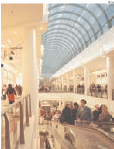
► OrioCenter: i suoi clienti creano code anche in città