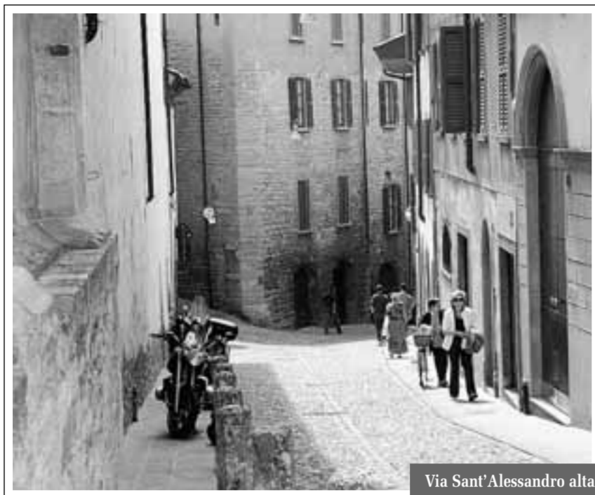
Via Sant'Alessandro alta