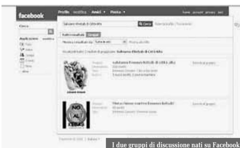
I due gruppi di discussione nati su Facebook

In definitiva le ideologie sono messe a bando. Chi difende il panino arabo lo fa per una questione di palato e di apertura culturale. Chi lo accusa, invece, per motivi di igiene e ordine pubblico, oppure semplicemente estetici. Tornando alla piazza reale, la Lega è ben de-