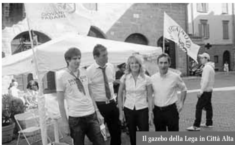
Il gazebo della Lega in Città Alta

La rete è per sua natura sfuggente, il gioco e l'ironia sono spesso la cifra comune degli interventi, magari messi fianco a fianco a sentenze dai toni più austeri e definitivi: così nel bel mezzo della discussione un facebooker estremista propone di mettere un kebab al posto della biblioteca Angelo Mai.