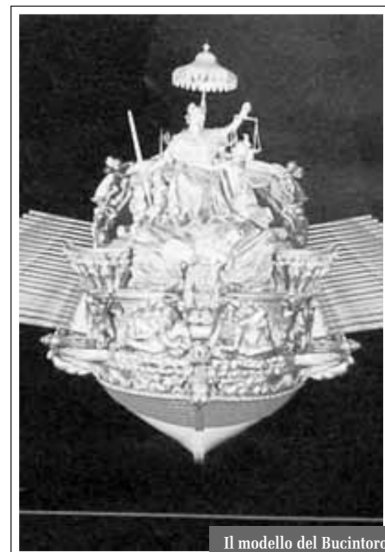
Il modello del Bucintoro