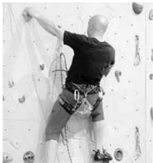
Nuovi percorsi d'arrampicata alla palestra del Cai. Le 2.000 prese sono state ricombinate in 24 linee

Presenze in crescita al Palamonti. Pronte 24 nuove linee con 2.000 prese: una sfida per grandi e piccoli climbers Il presidente Valoti: «È un luogo per fare sport adatto a tutta la famiglia, ma anche un punto d'aggregazione»