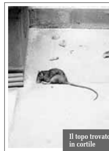
Il topo trovato in cortile

«A parte che non mi compete rimuovere l'animale - aggiunge il dottor Gambarelli - c'è anche da