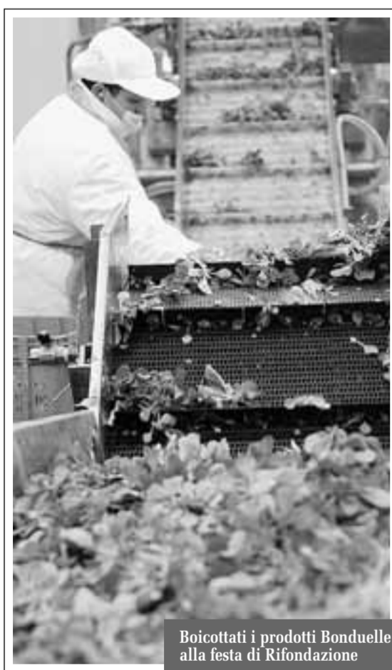
Boicottati i prodotti Bonduelle alla festa di Rifondazione