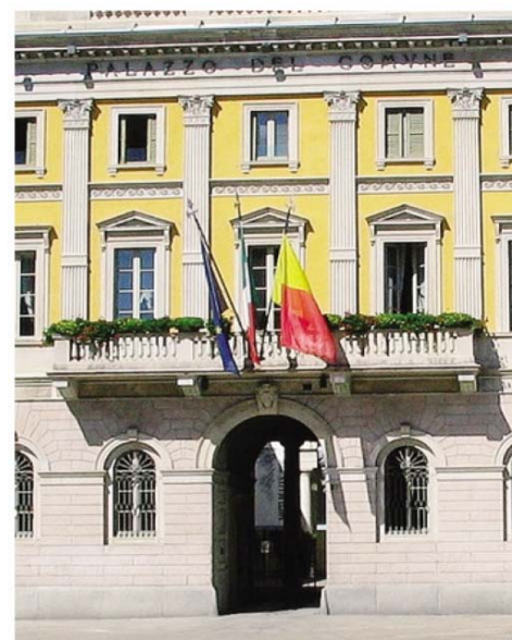
La sede del Comune a Palazzo Frizzoni

Il risarcimento avrebbe una portata nazionale, visto che nel 2012 il governo Monti operò un taglio, distribuito sui Comuni, di 2,25 miliardi di euro (decurtati nel 2013). A sollevare per primo la questione contro il ministero fu il Comune di Lecce, che nel 2014 portava all'attenzione del Tar del Lazio dubbi sulla legittimità costituzionale del decreto «spending review». Poi la Consulta si è pronunciata nel giugno 2016, con una sentenza che stabilisce, fra l'altro, che non è giustificata