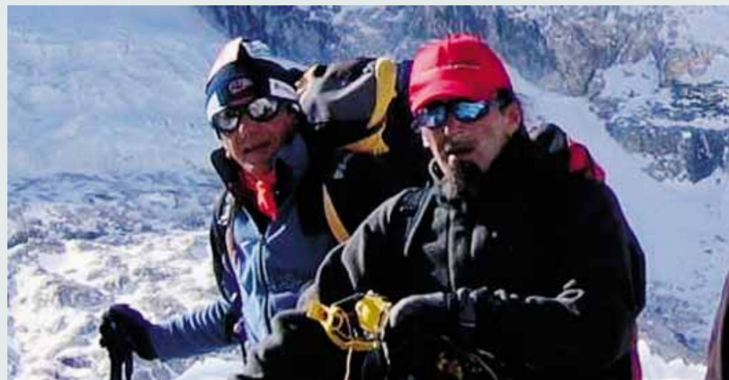
Falchetti a pagina 25

Amarezza, sconforto, tanta paura: questi gli stati d'animo dei lavoratori TenarisDalmine dopo l'annuncio del piano che prevede possibili tagli fino a 1.024 posti di lavoro (836 in Bergamasca). Tanta preoccupazione, riassunta in domande del tipo: «Ho lavorato una vita in questa fabbrica, ora cosa mi rimane?», mentre il pensiero corre ai più giovani: «Per loro sarà durissima». Ma ieri è stato anche il giorno dei commenti. Mentre i sindaci di Dalmine e Costa Volpino assicurano il massimo sostegno, cinque deputati Pd hanno presentato un'interrogazione ai ministri del Lavoro e dello Sviluppo economico.