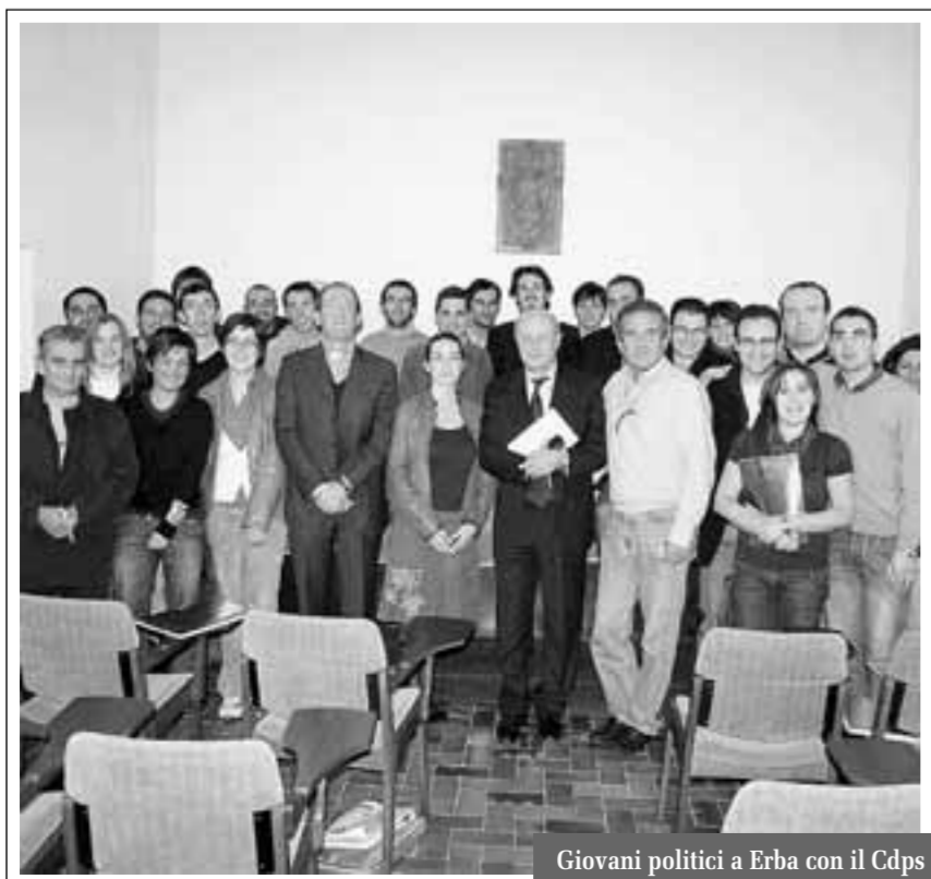
Giovani politici a Erba con il Cdps