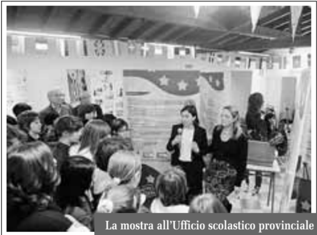
La mostra all'Ufficio scolastico provinciale

Un evento espositivo dedicato alla storia e alle istituzioni europee, una mostra da guardare e da fare, ricca di laboratori linguistici, viaggi creativi nell'arte, itinerari multimediali, video e opere sul cammino dell'unione europea, realizzati dagli studenti del liceo Capitano. «Viaggiano per l'Europa e nel mondo, grazie agli scambi interculturali, i nostri studenti non solo crescono in un ambiente attento alla formazione integrale della persona e ai bisogni dell'età giovanile, ma possono acquisire anche tutte quelle competenze linguistiche richieste dal mondo del lavoro e maturare espe-