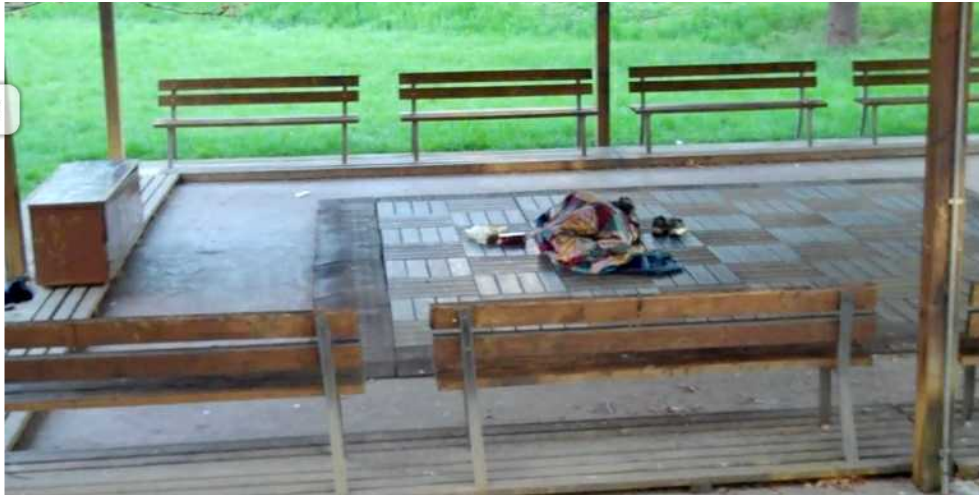
I senzatetto al Parco Rosselli