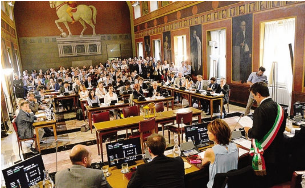
Il primo Consiglio comunale targato Gori. Ieri la riunione dei capigruppo per le commissioni

La decisione presa dalla Conferenza dei capigruppo. Ultima parola al Consiglio