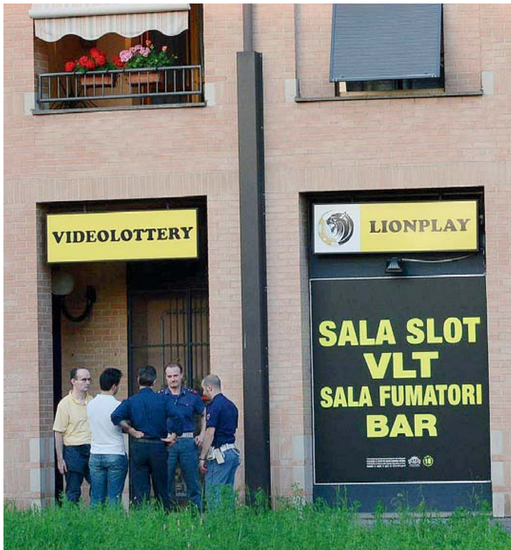
Il locale videolottery aperto un mese fa in via Tiepolo e già rapinato