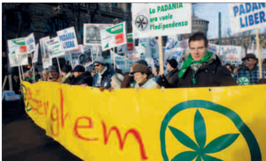
Sfilata leghista: il Carroccio è il partito più critico contro il governo Monti

pari al 59%, degli oneri di urbanizzazione previsti. «E' positivo che solo il 41% degli oneri di urbanizzazione, pari a 2,5 milioni su 6, vengano utilizzati per la copertura del disavanzo economico, in luogo del 75% utilizzato gli anni precedenti. Gli oneri di urbanizzazione dovrebbero come sappiamo essere utilizzati principalmente per gli investimenti in conto capitale e non per la copertura della spesa corrente. Il disavanzo economico, infine, diminuisce di quasi 6,5 milioni, dai 9 milioni del 2011 ai 2,5 del 2012». Ribolla lancia un'altra stoccata al Governo: «Se siamo arrivati con questo caldo estivo ad approvare i bilanci è perché i Comuni non sono stati messi in grado di determinare le ricadute negative delle misure in continua evoluzione introdotte da Roma. Forse questa difficile situazione, anche a carattere internazionale, mai verificata nel passato, porterà davvero a quanto ha sostenuto settimana scorsa il Financial Times, dando ragione alla Lega Nord e smontando pezzo per pezzo la politica economica del governo, ovvero che la prossima Europa sarà più piccola e solo con il Nord Italia, perché le misure attuate dal nostro Paese sono fallimentari».