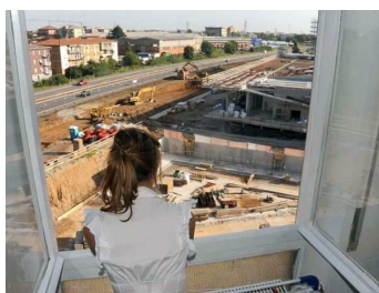
Il cantiere in via Autostrada