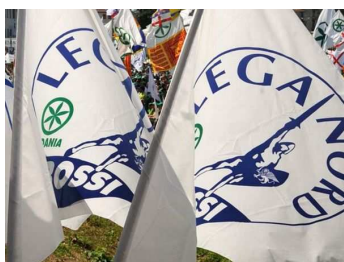
Bandiere della Lega Nord