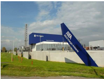
L'inceneritore di Dalmine della Rea

I rifiuti del Sud? La Bergamo leghista non ne vuole proprio sapere di accollarsi il peso della «monnezza» di Napoli e a seguito della presentazione di un ordine del giorno alla Camera proposto dal Pd, che tra l'altro è stato bocciato dal Governo, alza la voce.