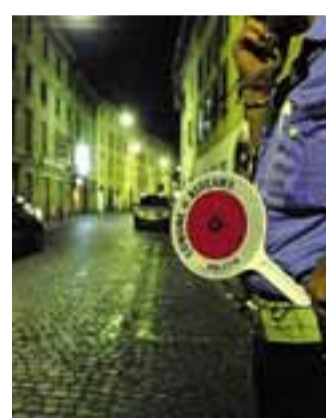
Presidio della polizia locale