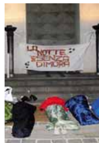
La notte dei senza dimora

Lunedì la manifestazione si sposta nell'area della stazione Autolinee. Dalle 10 alle 24 gli operatori del servizio Esodo e i volontari dell'associazione «In strada» saranno presenti tra le pensiline per illustrare finalità e contenuti del servizio che svolgono tutti i giorni in stazione. A mezzogiorno, al posto caldo del-