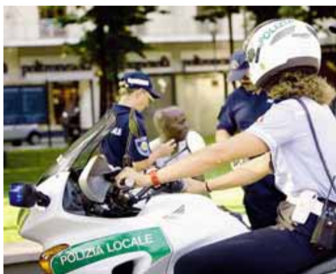
I vigili controllano un immigrato

Via Quarenghi nell'arco di un'ora cambia volto. Fino all'orario di apertura dei negozi è animata, poi con la chiusura dopo le 20 cala il buio e la strada praticamente si svuota. Il coprifuoco si può dire che sia «naturale», ancor prima che arrivi l'ordinanza. L'unico luogo che resta animato è il kebab a metà di via Quarenghi.