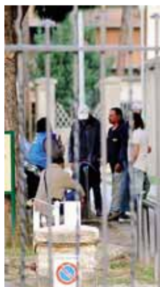
Sbandati alla Malpensata

del mercato del lunedì, acquisizione dell'area dell'ex gasometro per un parcheggio. «Le proposte - aggiunge l'Amministrazione comunale - verranno sottoposte alla Circoscrizione, ai comitati, ai cittadini e, per quanto di competenza, al Consiglio comunale, per le necessarie integrazioni e valutazioni. Il "Piano Malpensata" è uno dei programmi più ambiziosi del mandato, e richiede tempo». Anche il presidente di Circoscrizione Alessandro Trotta riba-