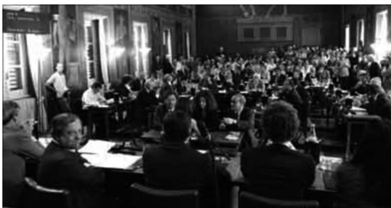
Il Consiglio comunale approva all'unanimità (33 i presenti) il documento Anci sulla Finanziaria