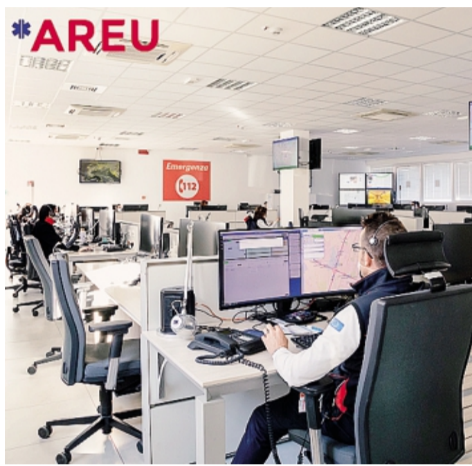
La Centrale operativa del «112 unico»

Oggi ricorre la «Giornata europea del numero unico di emergenza europeo 112», noto anche come «Nue 112». Un servizio attivato nel 2010 con una prima sperimentazione a Varese: sperimentazione alla quale aderì fin da subito l'allora 118 di Bergamo con la Centrale operativa che aveva sede all'interno degli Ospedali Riuniti. Nel corso degli anni il servizio è stato progressivamente esteso a tutto il territorio regionale, applicando un modello di gestione delle chiamate realizzato in attuazione della normativa dell'Unione europea. «Si tratta di un servizio fondamentale - sottolinea l'assessore regionale al