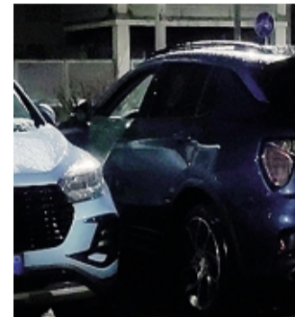
Auto scassinate in via Berizzi

Furti su auto in via Berizzi e in via Gleno «Intervenire»