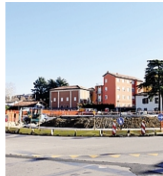
La nuova rotonda

Via Autostrada Da giovedì lavori di notte alla rotonda