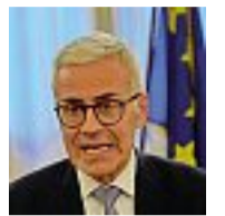
Il prefetto Giuseppe Forlenza

Più controlli, nelle aree sensibili e in quelle in cui i ragazzi si ritrovano. È quanto deciso dalla riunione del Comitato provinciale per l'ordine e la sicurezza pubblica, presieduta dal prefetto Giuseppe Forlenza, dopo la maxi rissa di domenica scorsa.