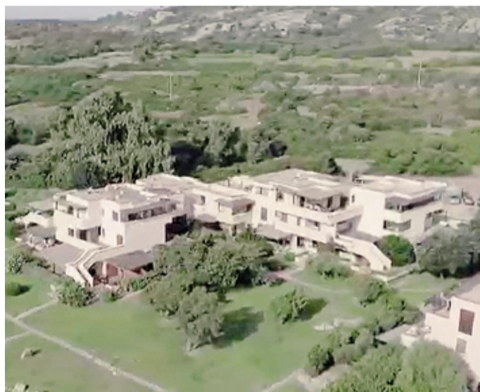
Il residence Punta Asfodeli in Sardegna