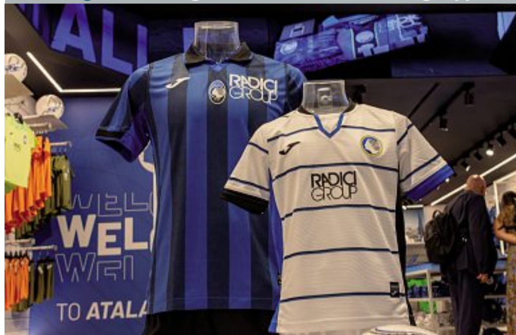
La nuova prima maglia dell'Atalanta (a sinistra) con le righe più sottili, e quella bianca a righe per la trasferta