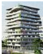
Una delle 5 palazzine da 10 piani pensate per riqualificare l'area della Ex Reggiani

Cinque palazzine da dieci piani con un effetto sinuoso. I rendering di uno studio di architettura di Bergamo danno l'idea di come potrebbe diventare l'ex Reggiani, con il complesso «Finardi 2». Ma ora, nel futuro incerto dell'area industriale al centro di una cessione mai completata a Pessina Costruzioni, spunta anche il giallo dei disegni mai pagati.