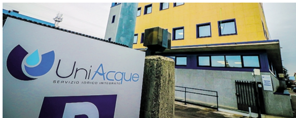
La sede di Uniacque, società che gestisce il servizio idrico integrato