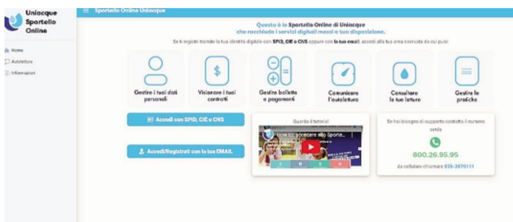
La schermata dello sportello online di Uniacque con cui si può pagare la bolletta