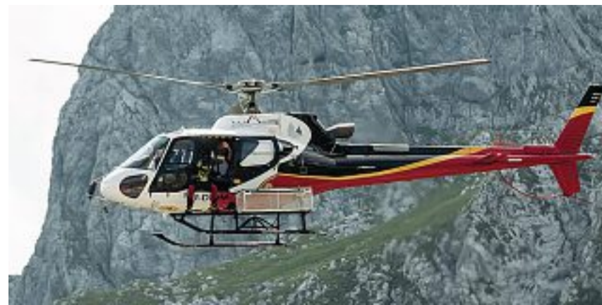
L'iniziativa Il 5 luglio fu celebrata una messa sulla Presolana per le vittime del Covid