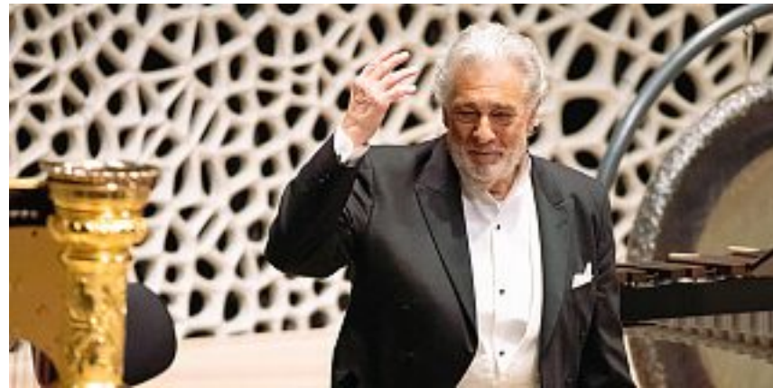
Sul palco Plácido Domingo si esibirà al Teatro Donizetti il 19 e il 26 novembre

La risposta del direttore del Donizetti a NonUnaDiMeno