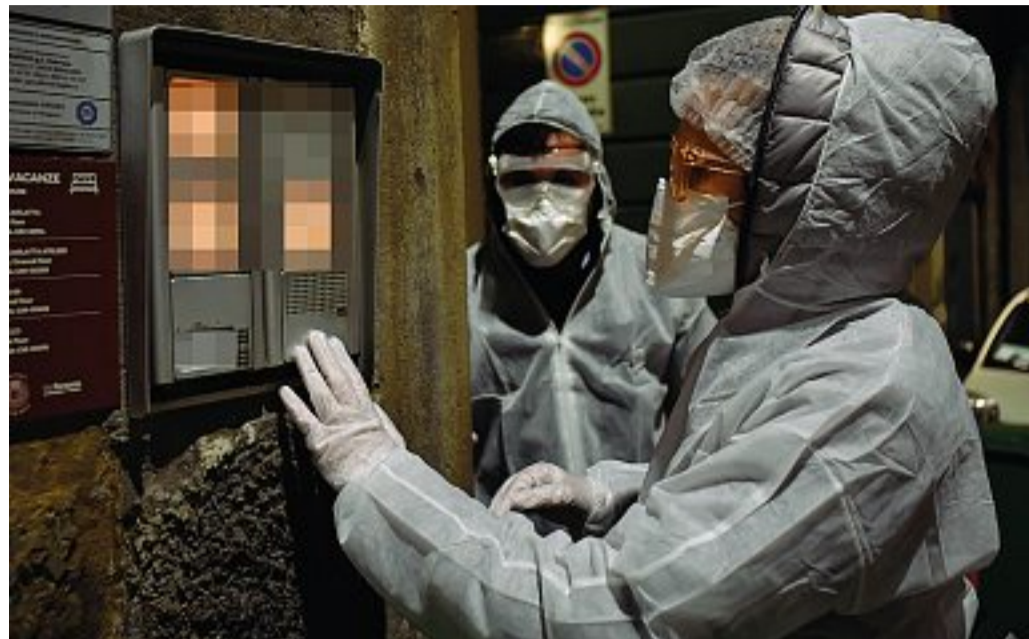
Sul territorio Usca: la gestione dei pazienti a domicilio è stato uno dei punti deboli dell'emergenza Covid 19