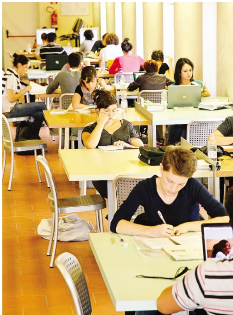
Gli studenti iscritti all'Università di Bergamo sono oltre 22 mila