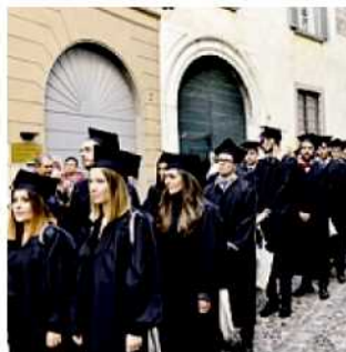
Neo laureati di UniBg

Buone notizie sul fronte del diritto allo studio. La nuova convenzione tra gli atenei lombardi e la Regione porterà nel 2019 nelle casse dell'Università di Bergamo il 111% in più delle risorse stanziare lo scorso anno. I finanziamenti passeranno così da 520 mila euro a un milione e centomila. Un passo in avanti importante considerato che l'ateneo orobico ha ottenuto in passato il 50% in meno dei fondi dovuti. La nuova convenzione tra Regione Lombardia e atenei lombardi sarà siglata nel mese di gennaio. Il diritto