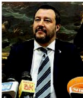
Il ministro dell'Interno Matteo Salvini